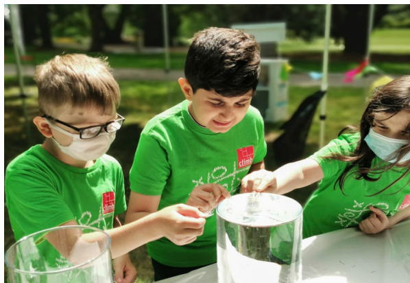
Abb. links: climb-Kinder aus Dortmund untersuchen in einem Naturprojekt die lokalen Gewässer Abb. rechts: In kleinen Forschungsprojekten lernen die climb-Kinder naturwissenschaftliches Denken und erfahren spielerisch Selbstwirksamkeit.