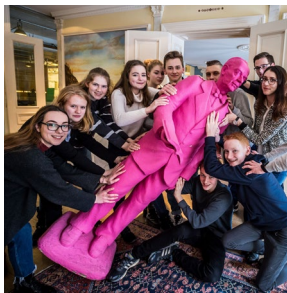
Kuratorische Teilhabe 76