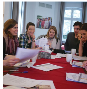
Ohne Jugend keine kulturelle Zukunft 92